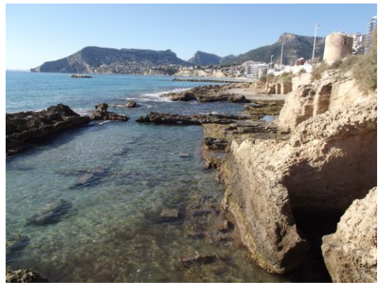
Calp is de Andalusische benaming, in het Spaans is het Calpe