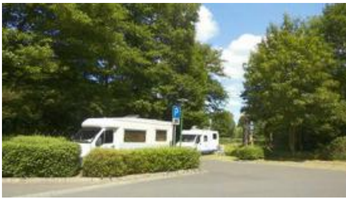
CP Bad Düben

Toch wel een aardige wandeling (7 km) en.....: het kan niet altijd super zijn. We hadden prachtig weer en dat is ook belangrijk.