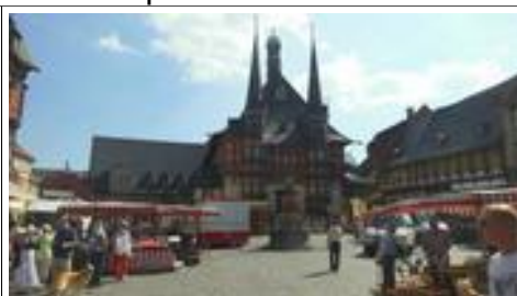
De Markt met oude stadhuis