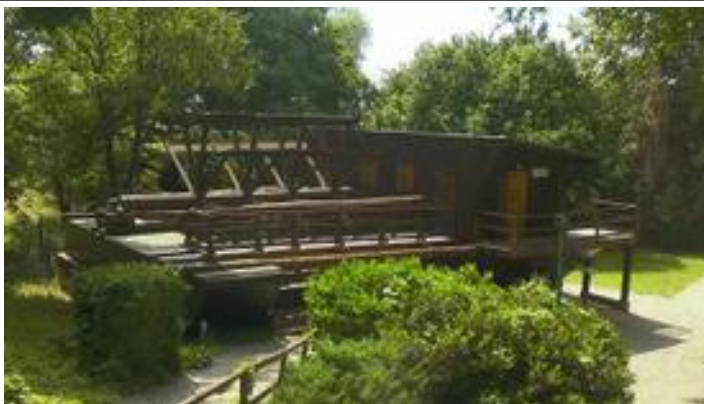
Drijvende watermolen op het droge