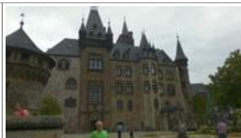
Het kasteel van dichtbij