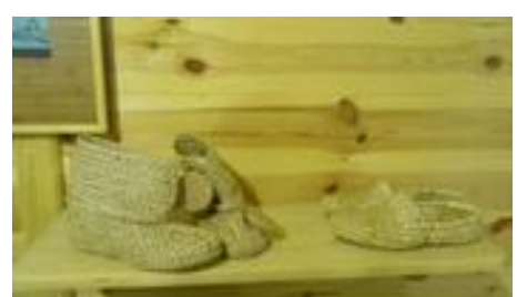
Enkele van de bewonderde vlecht(kunst)werken in het museum Novy Tomysl