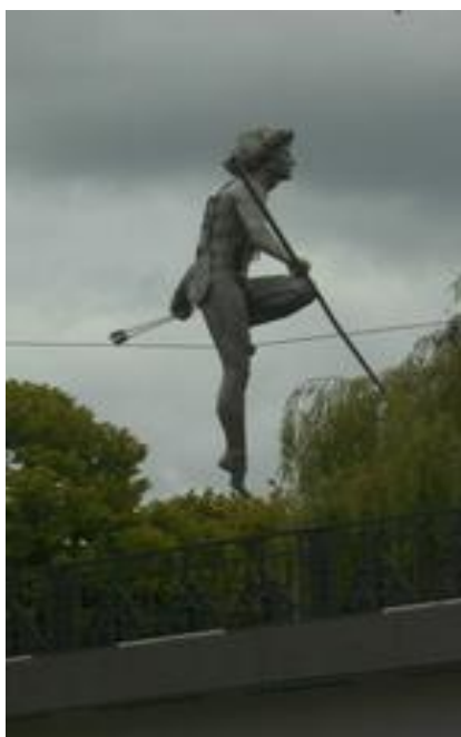
Een interessant beeld van een kennelijk beroemde kunstenaar uit Bydgoszcz. We konden géén voor ons leesbare bijzonderheden over deze held vinden.