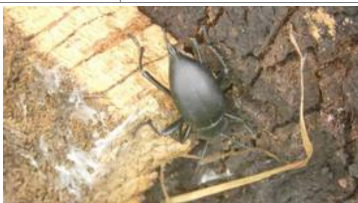
Deze rakker vonden we onder een stuk kurkschors