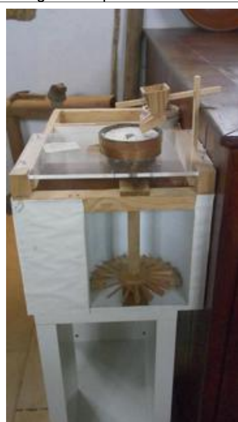
Schaalmodel toont de werking. Het onderste schoepenwiel werd door het water aangedreven