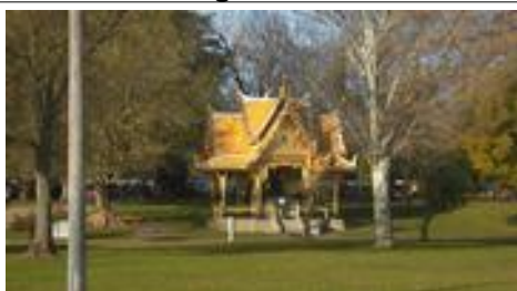
Herinnering aan de band met China

Een heel kleine impressie van Lissabon geven de foto's weer.