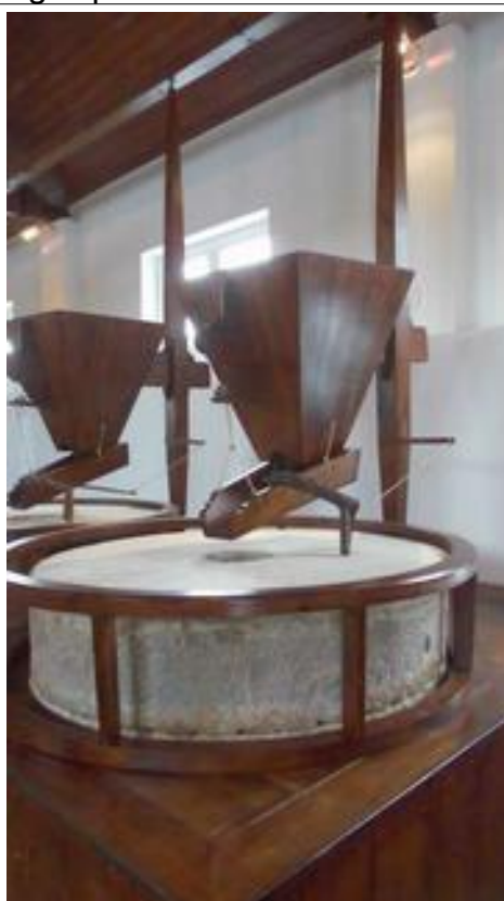
Molentrichter en -steen