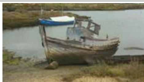
Zoiets MOET op de foto!