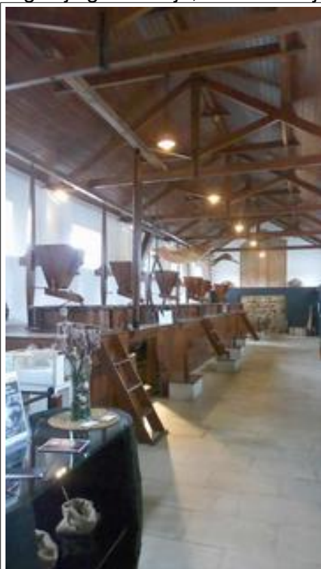
De zes molens, aangestuurd door de getijdenstroming die met een sluizensysteem gereguleerd werd