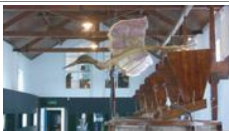
Mooie decoratie in de hal