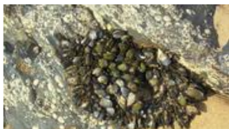
Mosselen, nog te klein om er een maaltijd mee te bereiden.

De nabij-gelegen nederzetting was onbereikbaar omdat de rivier de weg blokkeerde en wij geen hoge laarzen bij ons hadden. Troost voor ons: Daar waren we vorige keer al!