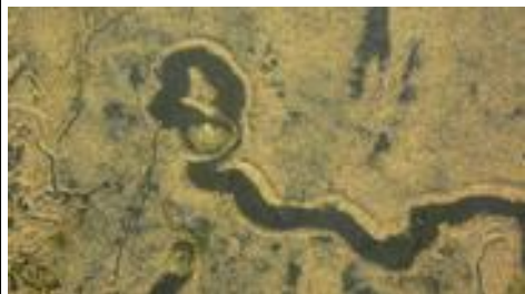
Het wandelpad van een schelp