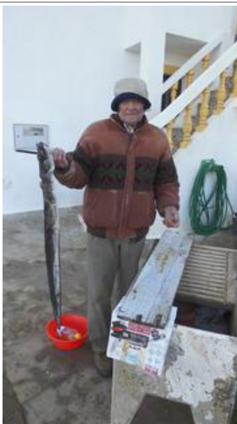
Klaar voor verwerking.....