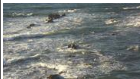
Zo zag foto 2 zes uur later uit

De volgende etappe gaat een flink stuk het binnenland in. Maar dat leest u in deel 9.