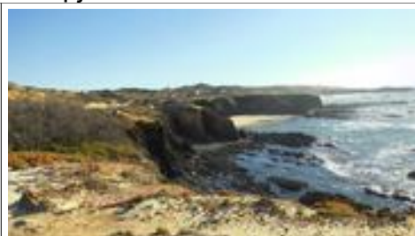
Uitzicht vanuit de camper