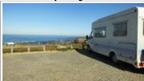
Alweer een droomplekje

Daar hadden we overigens al rap spijt van want het werd heerlijk weer. Via een trapje kwamen we bij de grillige rotsformaties die nauwelijks plaats lieten voor strand. Ook nu was het kijken en snuffelen, opzoek naar oceaانبewoners want we liepen immers over een stukje oceaانبodem. Deze wandeling, of liever klauterpartij was 6 uur later niet mogelijk omdat het toen ruim onder water stond. Het extra attractieve van deze kust is dat je maar een klein stukje hoeft te lopen om weer een totaal ander beeld voorgeschoteld te krijgen. Voor we het wisten stonden we bij een soort haventje met enkele keetjes echter zonder boten.... Borden vermeldde dat het een visserhaventje was. We zagen daar mensen tussen de rotsblokken in de weer met een net en een soort harkje. Rees natuurlijk de vraag: "Wat zijn die aan het vergaren?" en omdat we geen laarzen hadden konden we ze ook niet op de vingers kijken. Twee mannen kwamen naar boven met emmers buit. Deze bestond uit.....: Zee-egels en een enkele zeester. Ze waren er blij mee, want dit schijnen delicatessen te zijn. Jammer dat de camera dienst weigerde, alweer de accu's leeg. Na deze wandel-klauter-wandeling van 3 uur keerden we terug bij de camper om zowel de camera- als onze accu's op te laden. In de namiddag wandelden-klauterden we een stuk de andere kant uit om uiteindelijk langs de oever van een klein riviertje en een piepklein dorpje weer 'thuis' te komen.