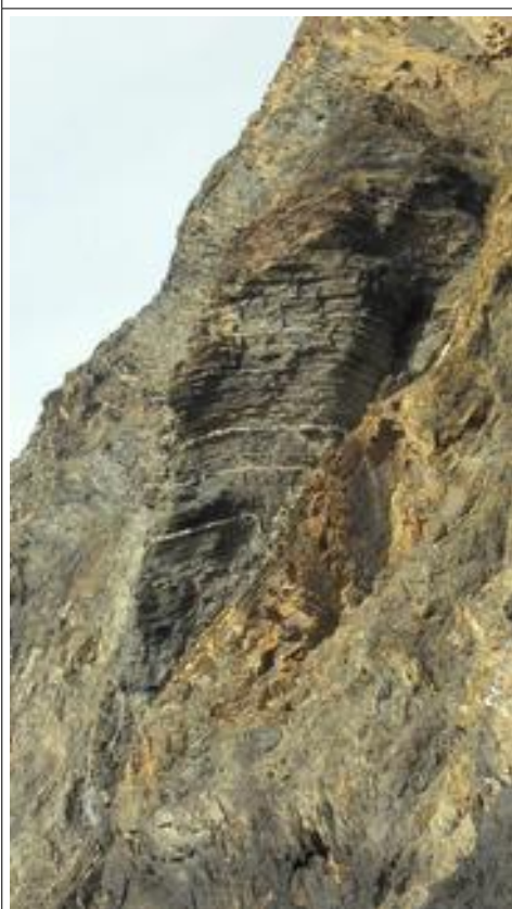
Snapshot van de helling