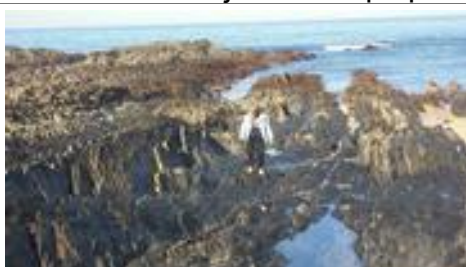
Speuren naar leven.....