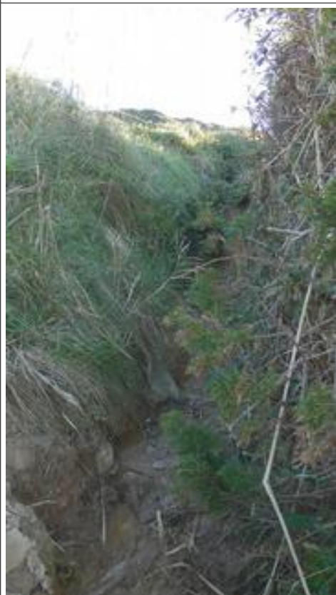
Het pad geen niet steeds 'over rozen'!