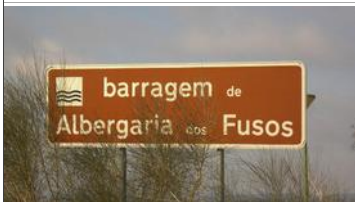
Ook deze standplaats.....

Het rijden, af en toe nog door de mist, was een route waar de chauffeur z'n koppie erbij moest houden. Maar qua landschappen: Geweldig! Zo belandden we bij een kennelijk erg mooie Romeinse opgraving maar deze was gesloten. Door het hekwerk toch maar even een foto gemaakt. Ook de aangegeven standplaats was minimaal. Volgend plekje gezocht en weer vrolijk verder. Af en toe friemelend door schatten van dorpjes, in het landschap schachttorens, wijzend op mijnbouw, maar geen actieve mijn gezien.