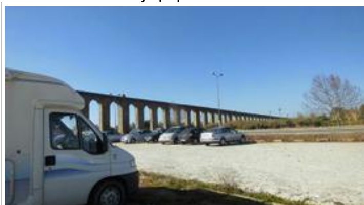
De parkeerplaats die we toch niet echt lekker vonden om te overnachten vanwege het voorbijrazend verkeer.