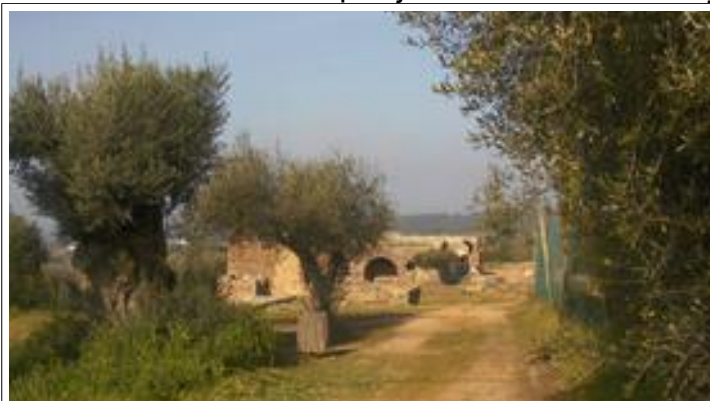
Een Romeinse opgraving, helaas niet toegankelijk

Ondanks redelijk veel verkeer kort langs de parkeerplaats hadden we toch een goede nachtrust. De zon had vandaag meer moeite om de redelijk dichte mist te verjagen maar slaagde er toch in. Weer een stukje verder, uiteindelijk wilden we deze reis Portugal nog nader leren kennen. Het eerder genoemde boekje "Mit dem Wohnmobil nach Portugal" diende als belangrijke leidraad maar werd niet precies gevolgd. De schrijver(s) hebben waarschijnlijk een deel van de verschillende routes met een erg compacte camper afgelegd want we werden af en toe -tevergeefs!- verleid tot wel erg krappe weggetjes en straatjes. De beschreven reizen zijn bovendien in het toeristenseizoen gemaakt waardoor er een aantal plekjes minder aantrekkelijk zijn voor de overwinteraar.