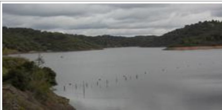
Pego do Altar

Bij aankomst was het droog en heel af en toe een straaltje zon. Dat betekende: Wandelen!