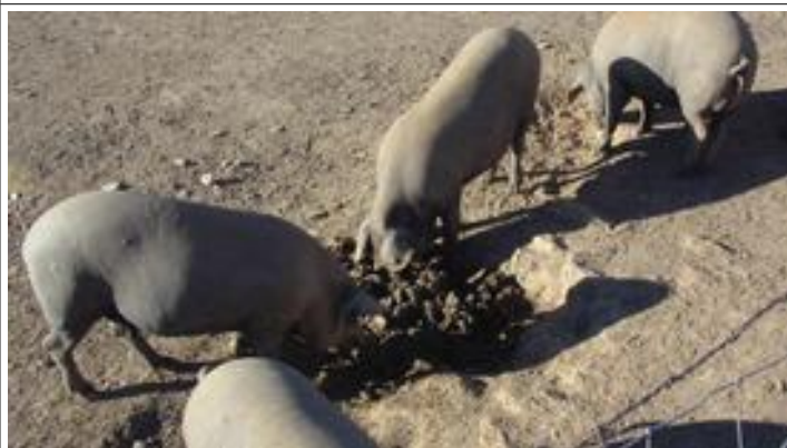
Lekker wroeten in de blubber....!

We zagen in vele supermarkten hun gedroogde achterham-met-poot hangen die al gauw tussen de 45 en 75 euro kosten. Wij kochten ook al twee keer bescheiden een paar onsjes in plakjes en, inderdaad: een smaakexplosie!