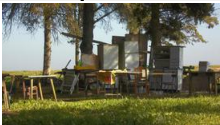
Vlakbij: Een openluchtkeuken!