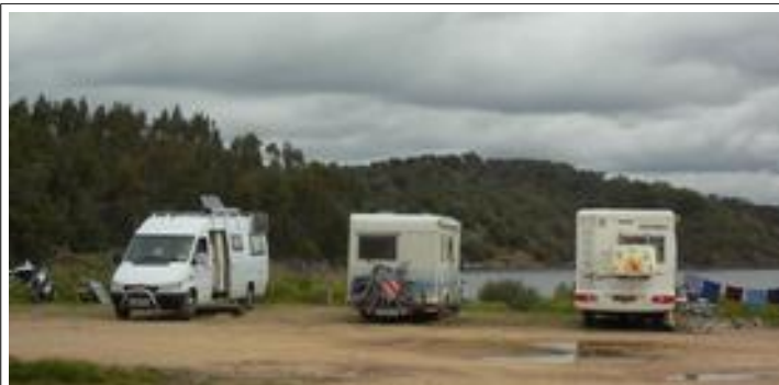
Drie van de 12 campers.....

We programmeerde de navi op ons volgend doel: Het stuwmeer Pego do Altar , een plaats waar we twee jaar tevoren tot grote tevredenheid stonden. Wel redelijk afgelegen van de bewoonde wereld maar een bekende plek onder campers. We volgden de instructies van de navi niet geheel want die had weer een paar erg smalle weggetjes in gedachten. Dat betekende wel zo'n 35 km extra rijden, temeer omdat we nog moesten Lidl-len. Onderweg regelmatig mieser maar ook liet de zon zich af en toe zien.