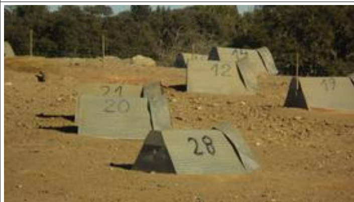
Behoeftte aan privacy? Even in je eigen hutje!