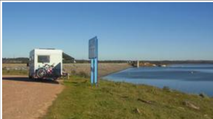
Hier was het wel vol te houden!

Zoals we onszelf beloofd hadden gingen we het binnenland in. Over overwegend goede maar bochtige en vaak smalle wegen door een landschappelijk afwisselingsrijk gebied kwamen we bij de beoogde bestemming, Garvao . Daar vonden we de sani-mogelijkheid die in het boekje stond maar een uurtje wandelen deed ons besluiten een meer boeiende of mooiere omgeving op te zoeken. Dat werd gevonden bij een groot stuwmeer, Montede Rocha . Terwijl we onderweg op veel plaatsen nog rijp op het gras zagen was het hier binnen de kortste keren korte-broeken-T-shirt-weer!