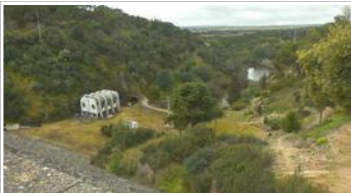
De mini-centrale in de diepte

We wandelden naar de onderzijde van de dam om via de andere stevige helling weer op camper-niveau te komen. We werden beloond met mooie vergezichten. Onderweg wijdde we een kleine studie aan het typisch Portugees product: De kurkeik.