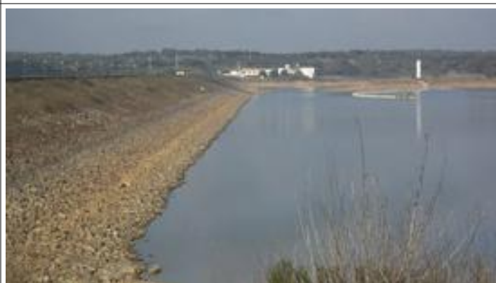
..... had het niet echt