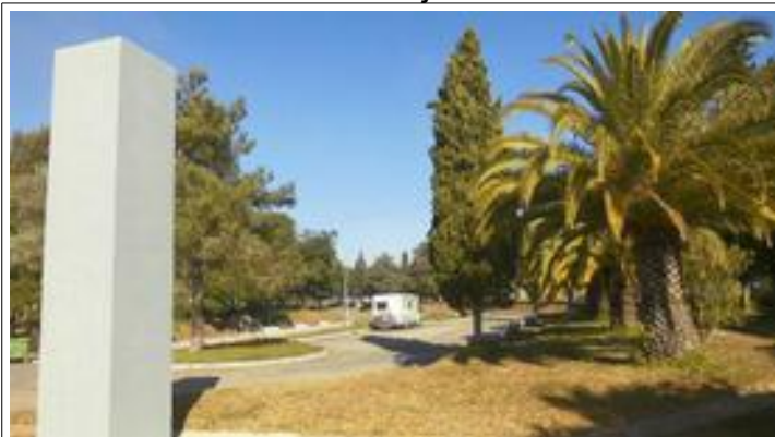
De erg eenzame picknicplaats

De volgende ochtend was het nevelig vanwege het verdampen van de rijp en natuurlijk door de aanwezigheid van het stuwmeer. Dus: Op ons dooie akkertje een kan koffie weggewerkt en de boel reisklaar gemaakt. Toen het zicht ruim voldoende was gingen we naar een volgend stuwmeer, zo'n 25 km noordelijker. Aangekomen bij Barragem de Roxo waar een soort picknicplaats was maakten we na de brunch een kuiertje om vast te stellen dat het er wel heel erg eenzaam en verlaten was.